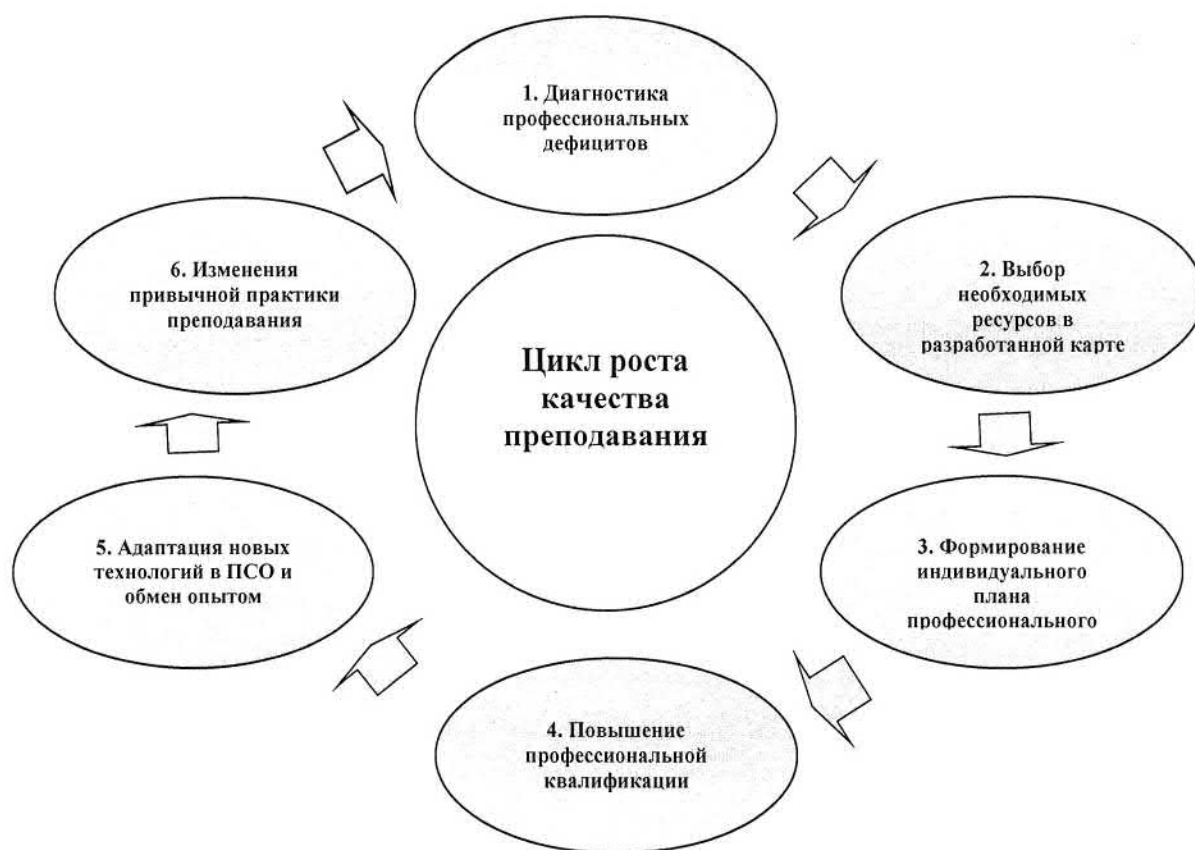
Рис. 2. Схема цикла профессионального развития, обеспечивающего повышение качества работы учителя.

Такая последовательность этапов, или шагов, в цикле профессионального развития не только обеспечивает целенаправленное повышение профессиональной квалификации отдельного педагога, но и создаёт основу для повышения педагогического потенциала всего педагогического коллектива.