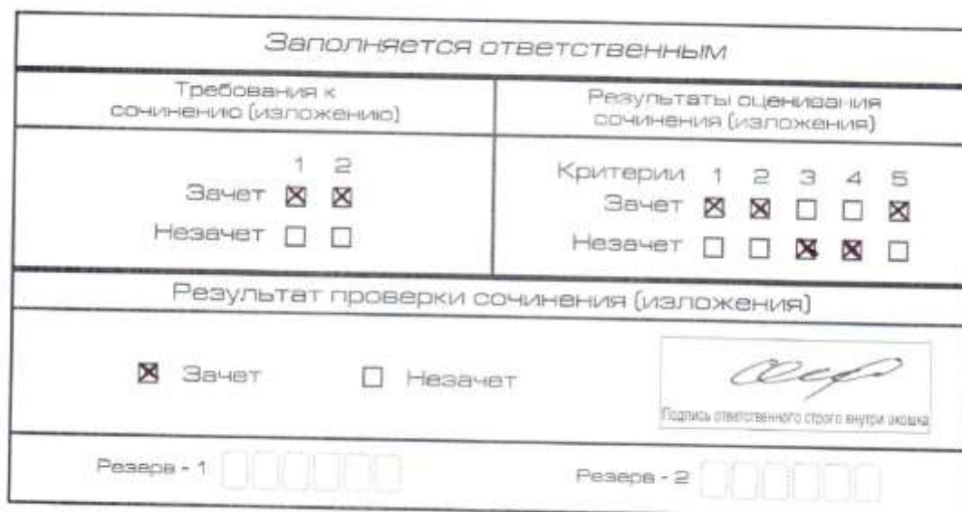
Рис. 6. Область для оценки работы

После окончания заполнения бланка регистрации ответственное лицо ставит свою подпись в специально отведенном для этого поле.