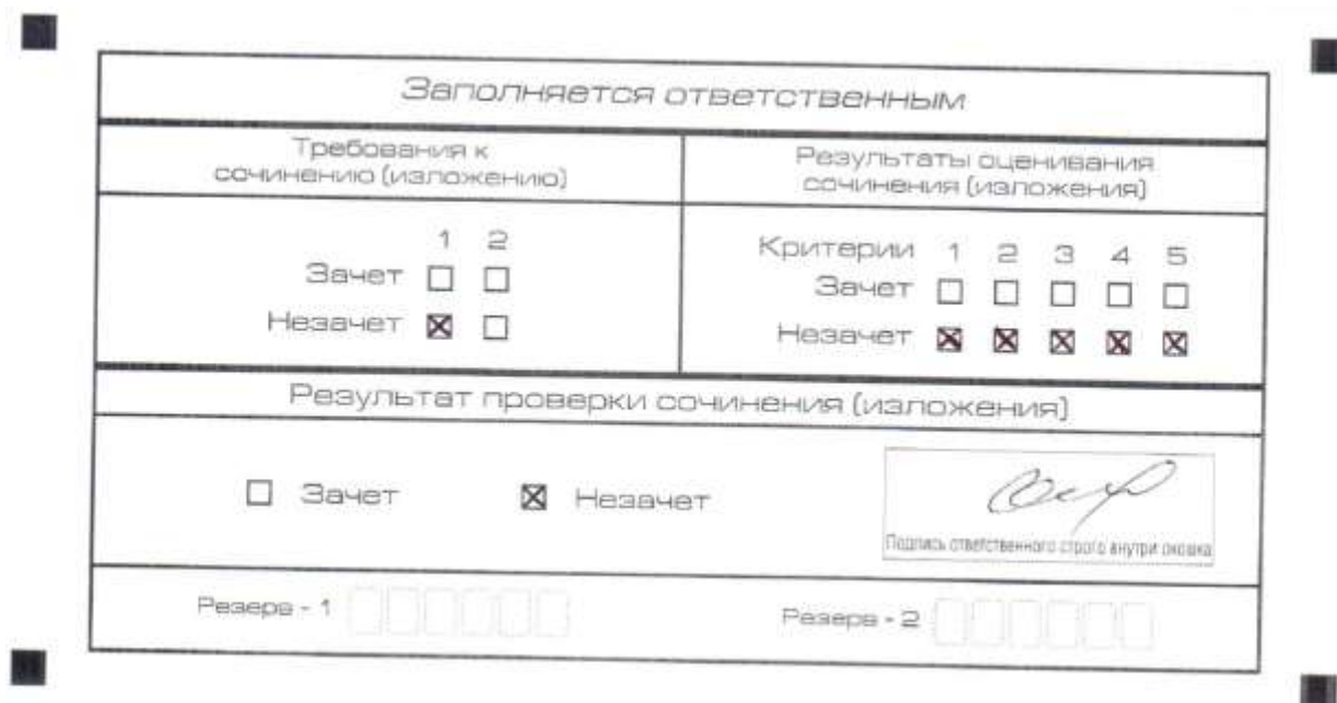
Рис. 5. Область для оценки работы

Эксперт комиссии (ответственное лицо) выставляет «незачет» за невыполнение требования № 2. В клетки по всем пяти критериям оценивания выставляется «незачет». В поле «Результат проверки сочинения (изложения) ставится «незачет».